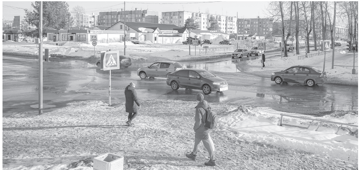
Перекресток улицы Советской – проспекта Ленина

перекрестке улицы Советской с проспектом Ленина, а также нерегулируемого пешеходного перехода в районе дома №49 на проспекте Ленина. На перекрестке заменят транспортные и пешеходные светофоры, обновят дорожные знаки; на переходе планируется установка Г-образных опор с мигающими желтыми светофорами и двусторонних пешеходных знаков с внутренней светодиодной подсветкой. Также в целях снижения скоростного режима автомобилей будут установлены искусственные неровности и проектор, проецирующий на пешеходный переход разметку