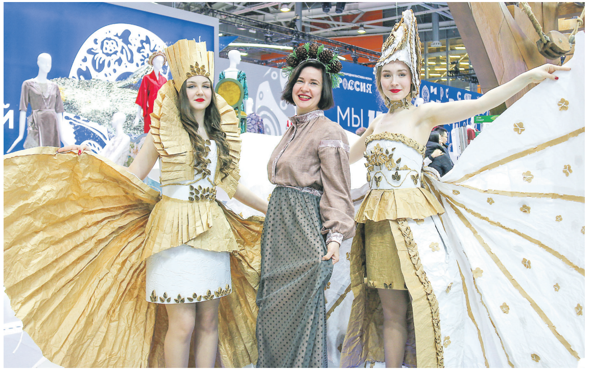
С «бумажными феями» каждый хотел сфотографироваться

Приятно было представлять город людям, которые никогда не слышали о нем, даже об Архангельской области имели са-