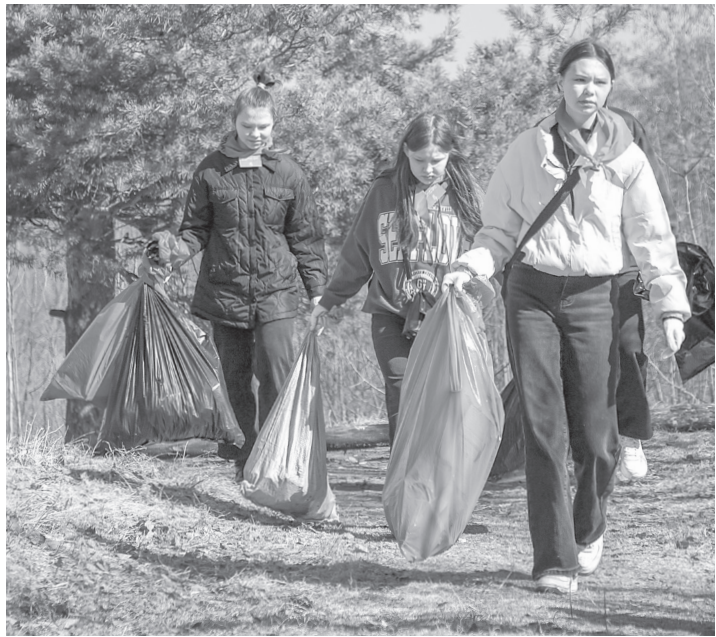
За два часа работы – 64 мешка мусора