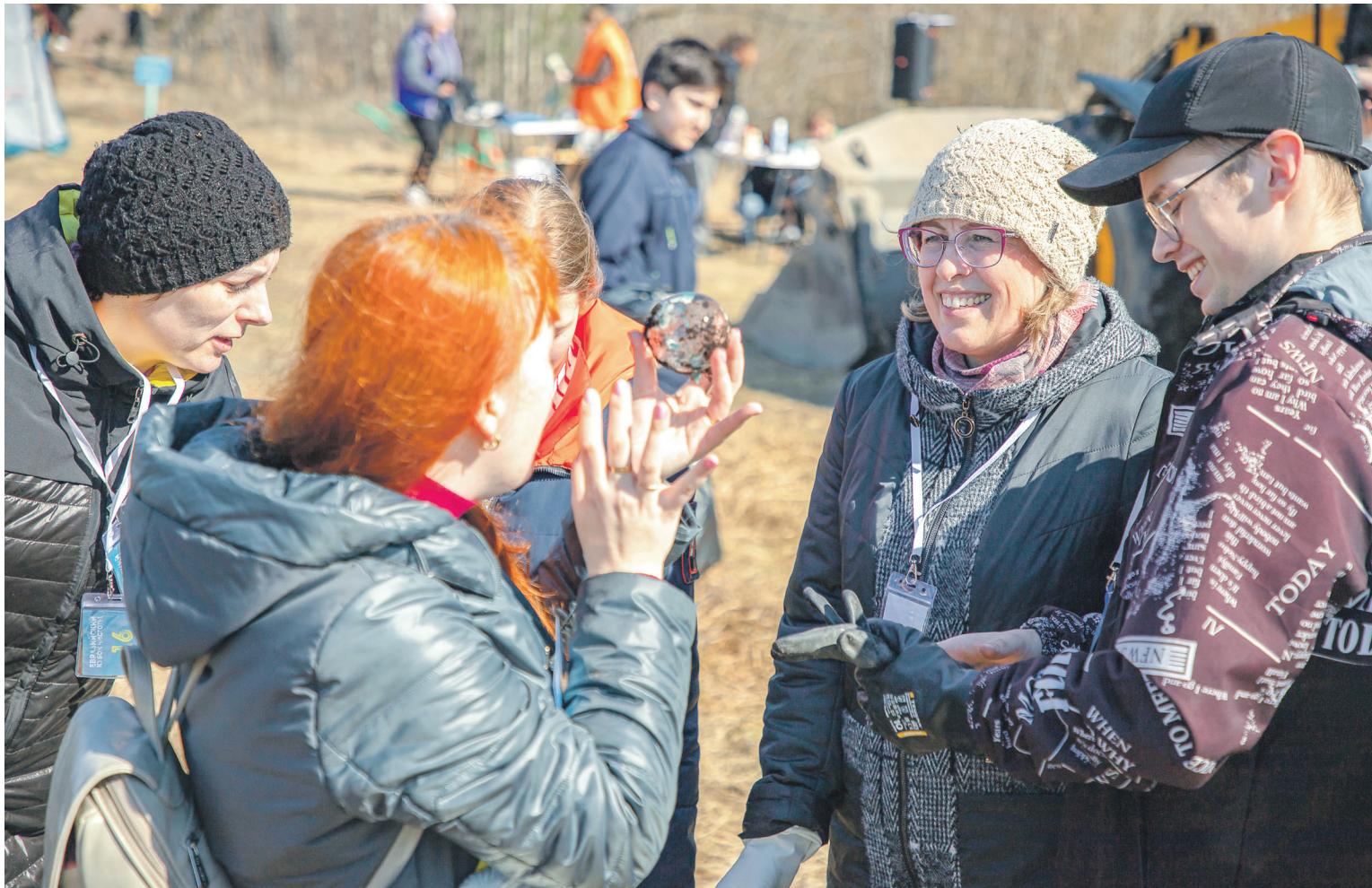
Один из этапов экомарафона – презентация необычной находки.