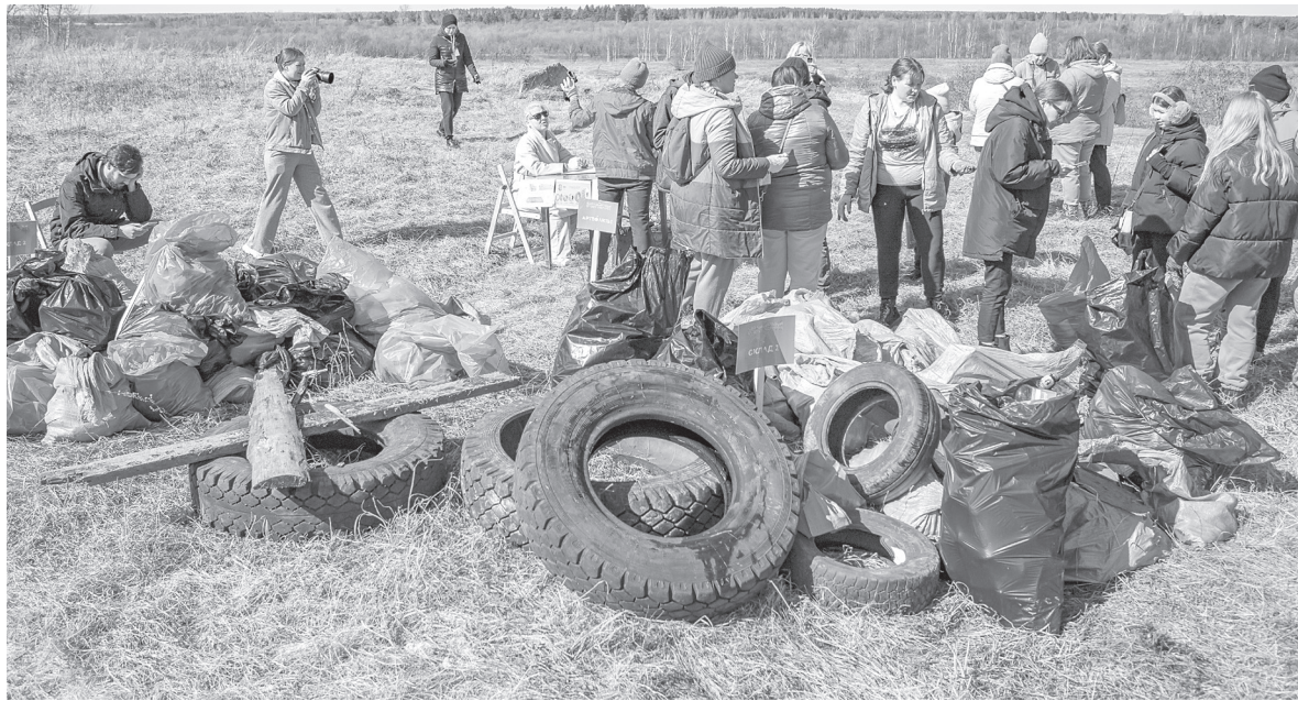
Правильно сортировать отходы – одна из задач экомарафона

21 апреля в Коряжме прошла первая игра в рамках Международного экологического проекта «Евразийский Кубок Чистоты». 14 команд, более 60 жителей, вышли на уборку общественной территории на набережной, возле дома 43а на проспекте Ленина. В общей сложности горожане собрали на этом участке свыше 400 кг мусора, около половины отходов отправили на вторичную переработку