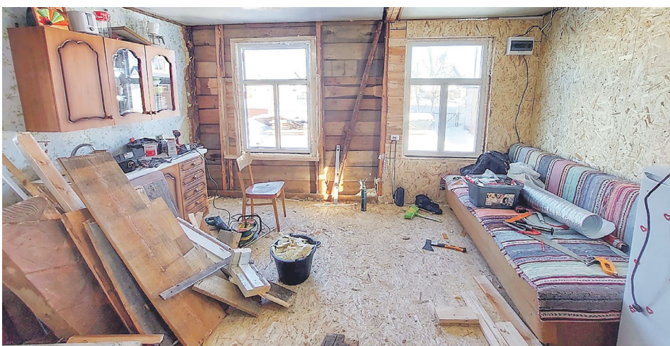
Любимая дача. Ремонт

Наталья Малых