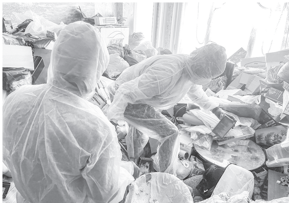
Специалисты клининговой компании собирают мусор в мешки