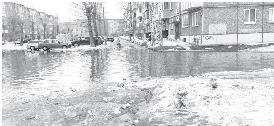
Лужа у дома №36а на проспекте Ленина.

рах и на дорогах колейность, каша и вода! Машины застревают, бамперы ломаются. Дороги во дворах непроезжие! Управляющие компании, где ваша техника?», «Когда же уже председатели СНТ «Строитель» и «Садоводы Севера» начнут по-человечески нанимать